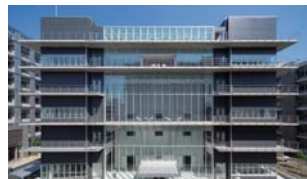
トランスフォーマティブ生命分子研究所(ITbM)