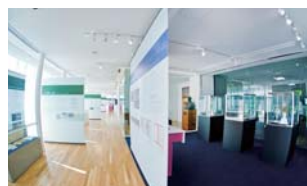
2008ノーベル賞展示室