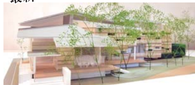
2017年11月開館予定のジェンダーリサーチ・ライブラリの完成イメージ