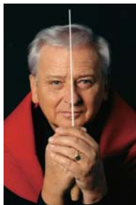
ラルフ・ワイケルト(指揮)